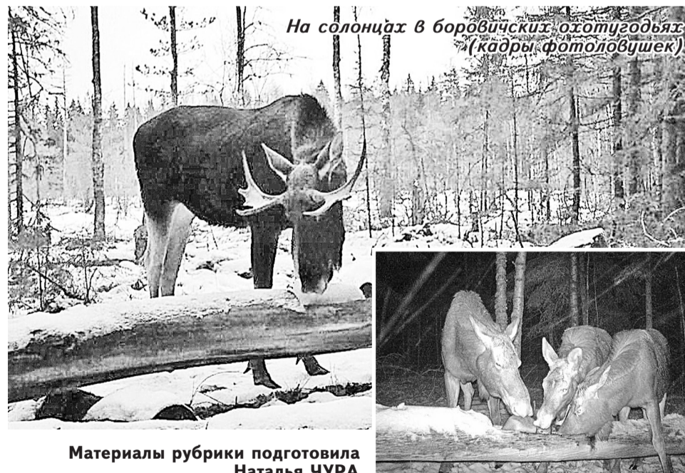
На солонцах в боровичских охотугодьях