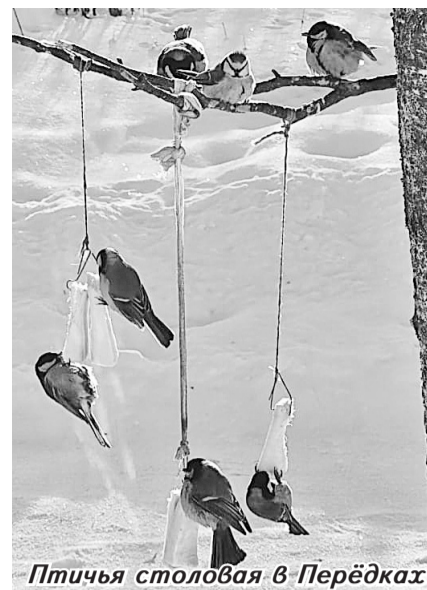
Птичья столовая в Передках

И это лишь один пример. А их много — как в городе, так и на селе. Кто-то подвешивает кормушку к балкону многоэтажки, некоторые умудряются приладить её к телевизионной «тарелке». Большинство, конечно, крепят к деревьям. Каждую зиму делают и развешивают кормушки у себя на территории дачников и школьники. Большинство из них — из