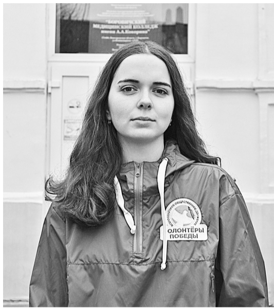
У стен родного колледжа